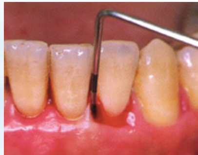
歯肉からの出血 (Bleeding on probing)