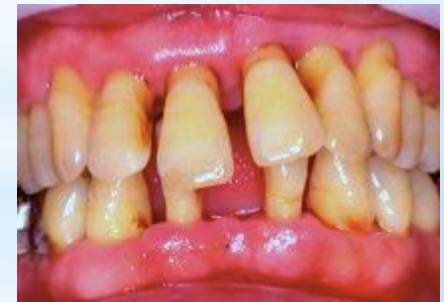
歯牙の動揺と 偏位