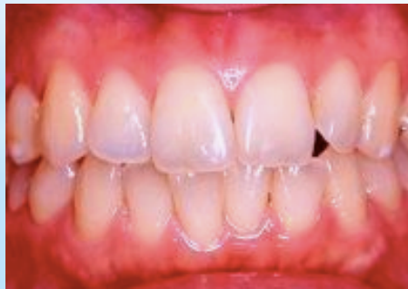
引き締まった歯肉