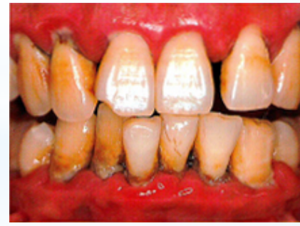
多量の歯垢と 歯石の付着