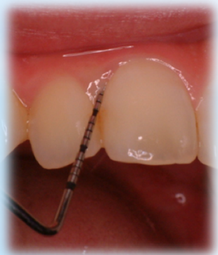
歯周ポケット検査