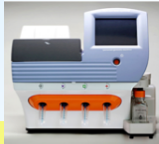
Ion PGM シーケンサー