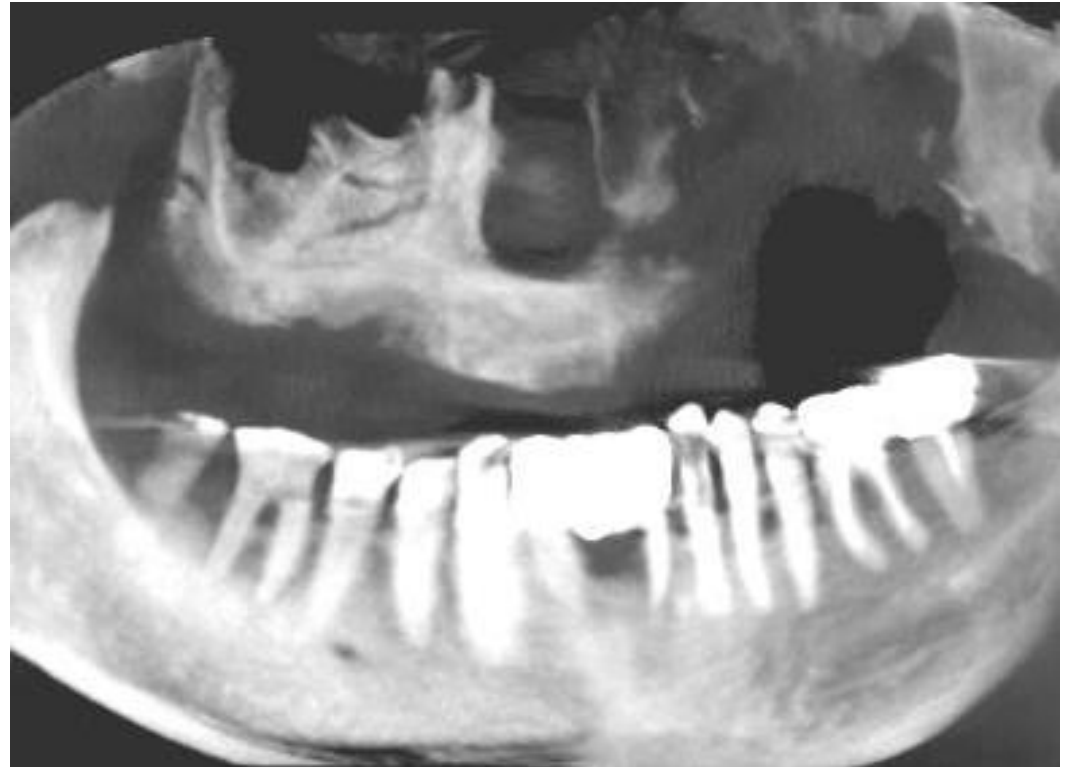
歯科用CTから構築したオルソパントモグラフ