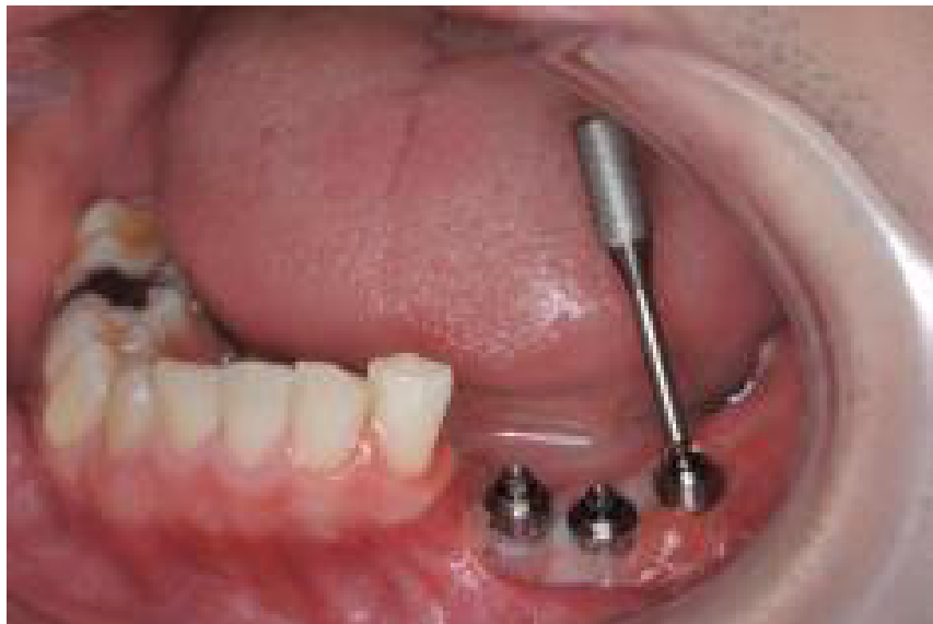
最遠心の補綴軸変更前