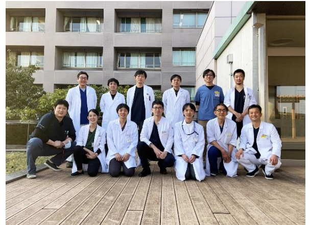
令和 2 年 3 月撮影

前立腺癌を確定診断するには針生検という体に負担を伴う検査が必要ですが、PSA が 4 を超えていても必ずしも前立腺癌とは限りません。直腸指診、超音波、MRI などの検査で前立腺癌が疑わしい場合にのみ行います。泌尿器科専門医が的確に判断しますので安心してご相談ください。