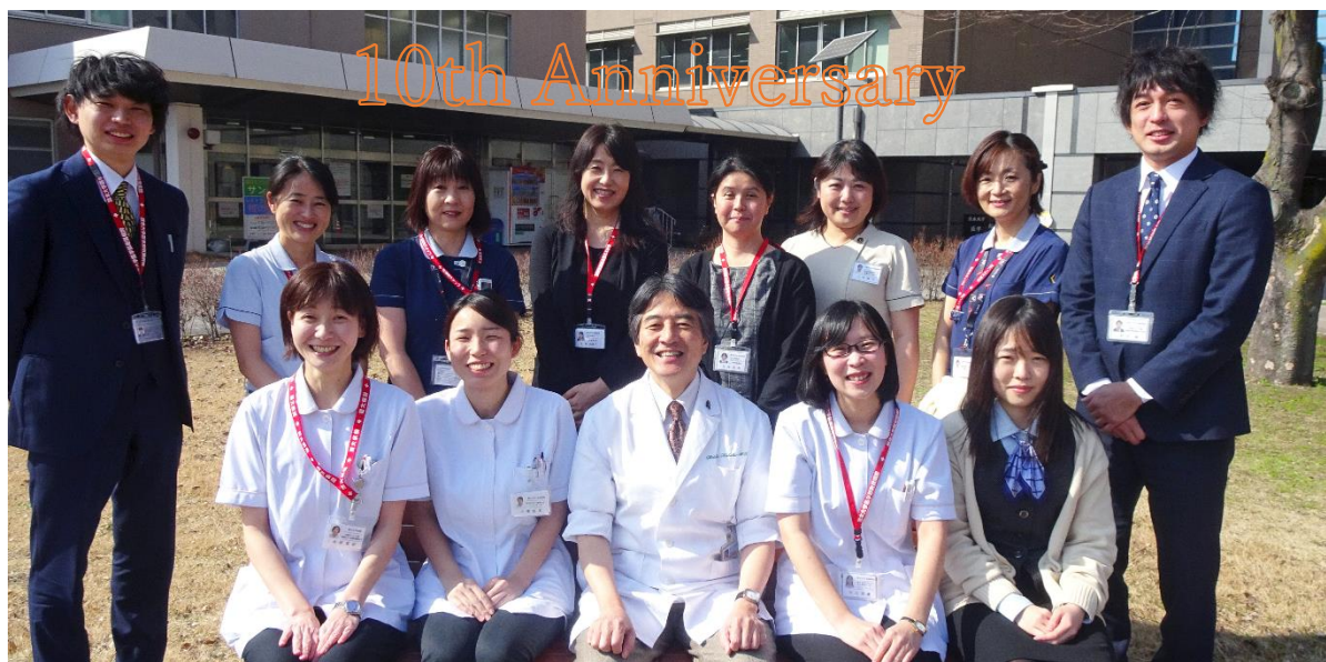
熊本県がん相談機能発展事業

日頃よりご活用いただいております各医療機関の先生方、スタッフの皆様にご改めまして感謝申し上げます。