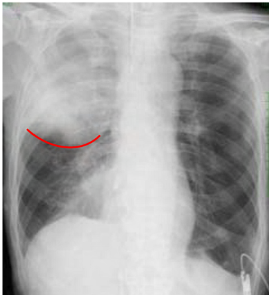
bulging fissure signが出現している