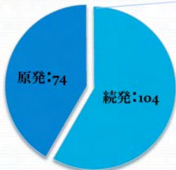
【SS の病型の割合(人数)】