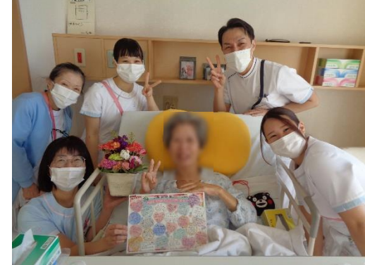
患者さまのお誕生日、職員でお祝いしました