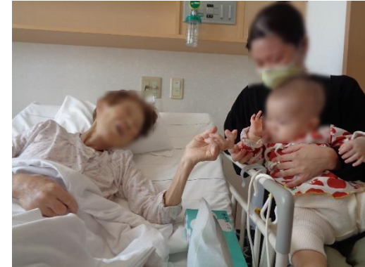
家族との時間を大切に、自由に面会できます (感染状況により変更することもございます)