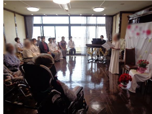
音楽の先生だった患者さまのコンサートを開催