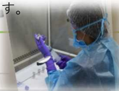
抗悪性腫瘍薬調製件数

抗がん剤の投与量に間違いが無いか確認し、薬剤師が抗がん剤の特性に合わせて、安全かつ正確に無菌調整を行っています。