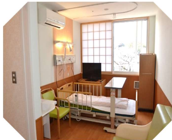
特別有料個室 Bタイプ (12m 2 )