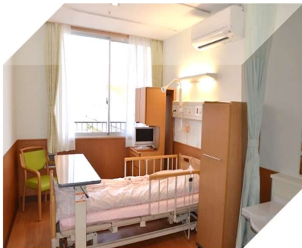
一般個室 (10m 2 )