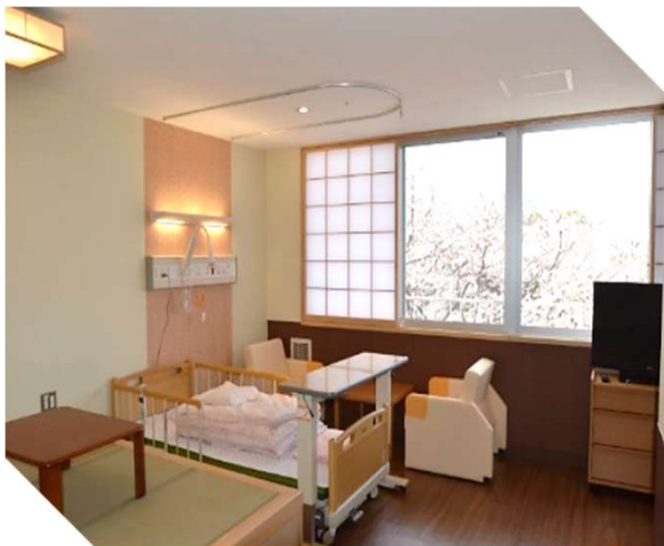
特別有料個室Aタイプ (21m 2 )