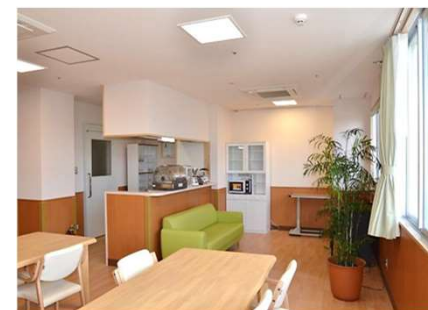
ファミリーキッチン